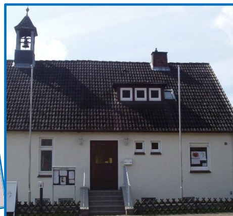
Versöhnung mit der ganzen Schöpfung