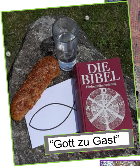
“Gott zu Gast”